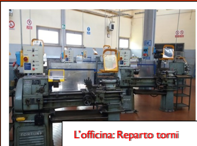
L'officina: Reparto tornii