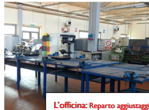
L'officina: Reparto aggiustaggio